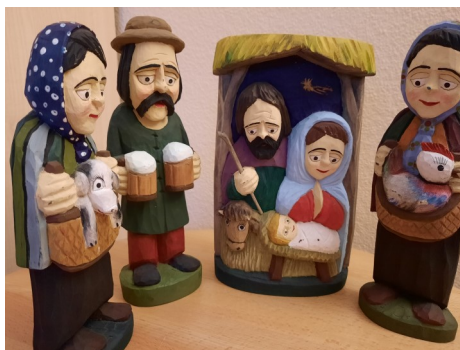
Polnische Krippendarstellung aus Fichtenholz

augenzwinkernde Humor: einer der Besucher bringt zwei Bier mit, eines für Josef und eins wohl für sich selbst. Ich kann mir richtig vorstellen, wie die beiden auf das neugeborene Kind anstoßen. Doch mehr als dieser Humor gefällt mir, was diese Krippe sagt: Es bedarf nichts Besonderem, um zu Jesus zu kommen, man muss weder ein besonderer Mensch sein, noch besondere Geschenke mitbringen. Also auf zu Jesus!