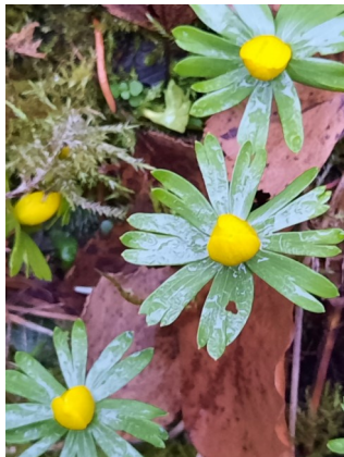
Die ersten Winterlinge im Garten des Geistlichen Zentrums