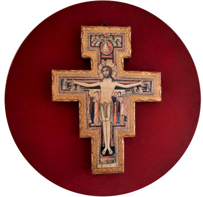
Das neue Kreuz im Gebetsraum des Geistlichen Zentrums

im Gebetsraum des Geistlichen Zentrums hängt ein neues Kreuz. Sie sehen es hier. In dem roten Kreis hebt es sich auf der weißen Wand hervor und zentriert den Blick. Das Kreuz ist ein Ort des Leidens und des Todes. Trotzdem ist es zum zentralen Zeichen des christlichen Glaubens geworden. Es ist das Versprechen Gottes, uns durch alle Dunkelheit hindurch zu begleiten, auch dann, wenn wir ihn nicht spüren. Es ist die Hoffnung, dass letzten Endes das Leben über den Tod und über alle Grausamkeiten hinweg siegen wird, denn das Kreuz ist untrennbar mit der Auferweckung Jesu Christi verbunden. Auf unserem Kreuz hier stehen Menschen bei dem gekreuzigten Jesus. Manche sind mit einem Heiligenschein gemalt, andere ohne, manche sind größer, andere kleiner. Sie erinnern mich daran, dass ich mich zu Jesus Christus stellen und dazu alle mitbringen kann, die mir nahe sind, deren Schicksal mein Herz berührt oder für die ich beten möchte.