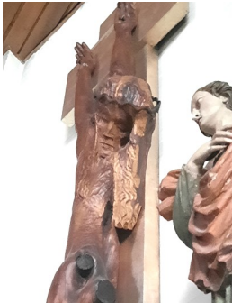
Kreuz in der Kirche St. Olaf