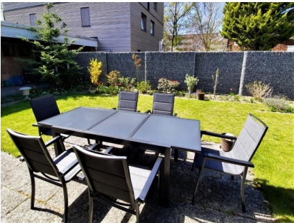
Garten des Geistlichen Zentrums

Auf ein Highlight des Sommers möchte ich besonders hinweisen: Bei dem neuen Projekt „Bibel Kreativ“ laden wir ein, einen biblischen Text auf kreative Weise darzustellen. Dabei sind der Fantasie keine Grenzen gesetzt. Die entstandenen Werke werden im Herbst in einer Ausstellung präsentiert. Weitere Details finden Sie auf der nächsten Seite.