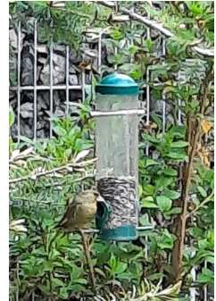
Gefiederte Gäste im Garten des Geistlichen Zentrums

Ein Jahr, das durch Corona völlig anders geprägt wurde, als ursprünglich gedacht. Vom Gästebetrieb, für den wir am Anfang alles vorbereitet haben, und Präsenzveranstaltungen, die es bis in den Oktober hinein noch gab, sind wir in den vergangenen Monaten digital geworden. Wir konnten Online-Erfahrungen sammeln mit Besinnungstagen, Exerzitien im Alltag, monatlichen Bibelgesprächen, Fastenimpulsen und einigem mehr. So ist uns ein unvorhergesehenes Standbein zugewachsen, das uns, auch über Corona hinaus, bleiben wird, denn es ermöglicht die Teilnahme und den Austausch auch über größere Distanzen hinweg.